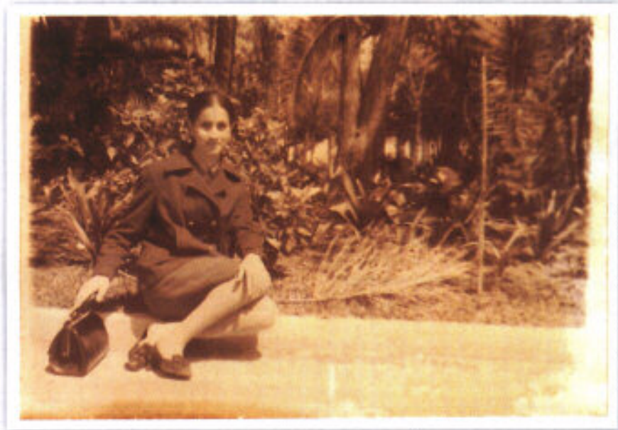
A l'école normale de Constantine, les années 1960

venues de toutes les villes et villages de l'est, la vie en internat, la discipline et la qualité de la formation donnèrent la marque au point qu'elle fera de ce passage un roman.