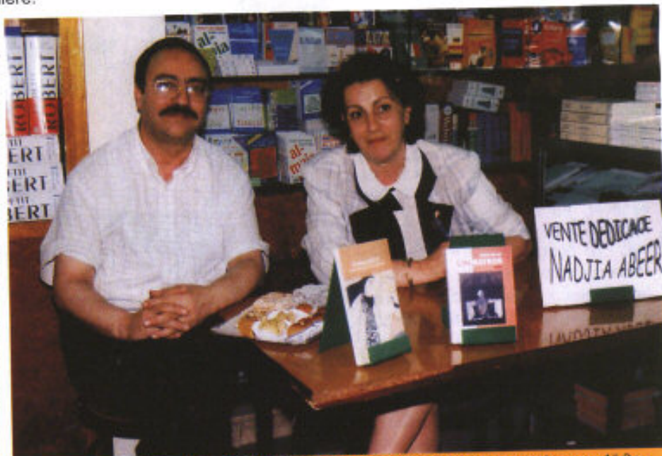
A la rencontre du public, dans la librairie du tiers monde avec Abderrahmane Al Bey

L'adolescence de l'écrivain va se confondre avec l'euphorie des années post-indépendance. Le scoutisme marquera cette génération, puis c'est l'entrée à l'Ecole Normale d'Institutrices en 1965, qui va changer le cours de sa vie. La rencontre avec de jeunes filles